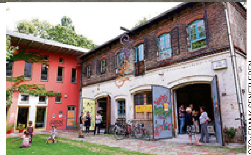
Die Fahrradwerkstatt im Alia-Mädchenzentrum. Zutritt nur für Mädchen